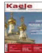
Kaële Magazine n° 30 Janvier 2007